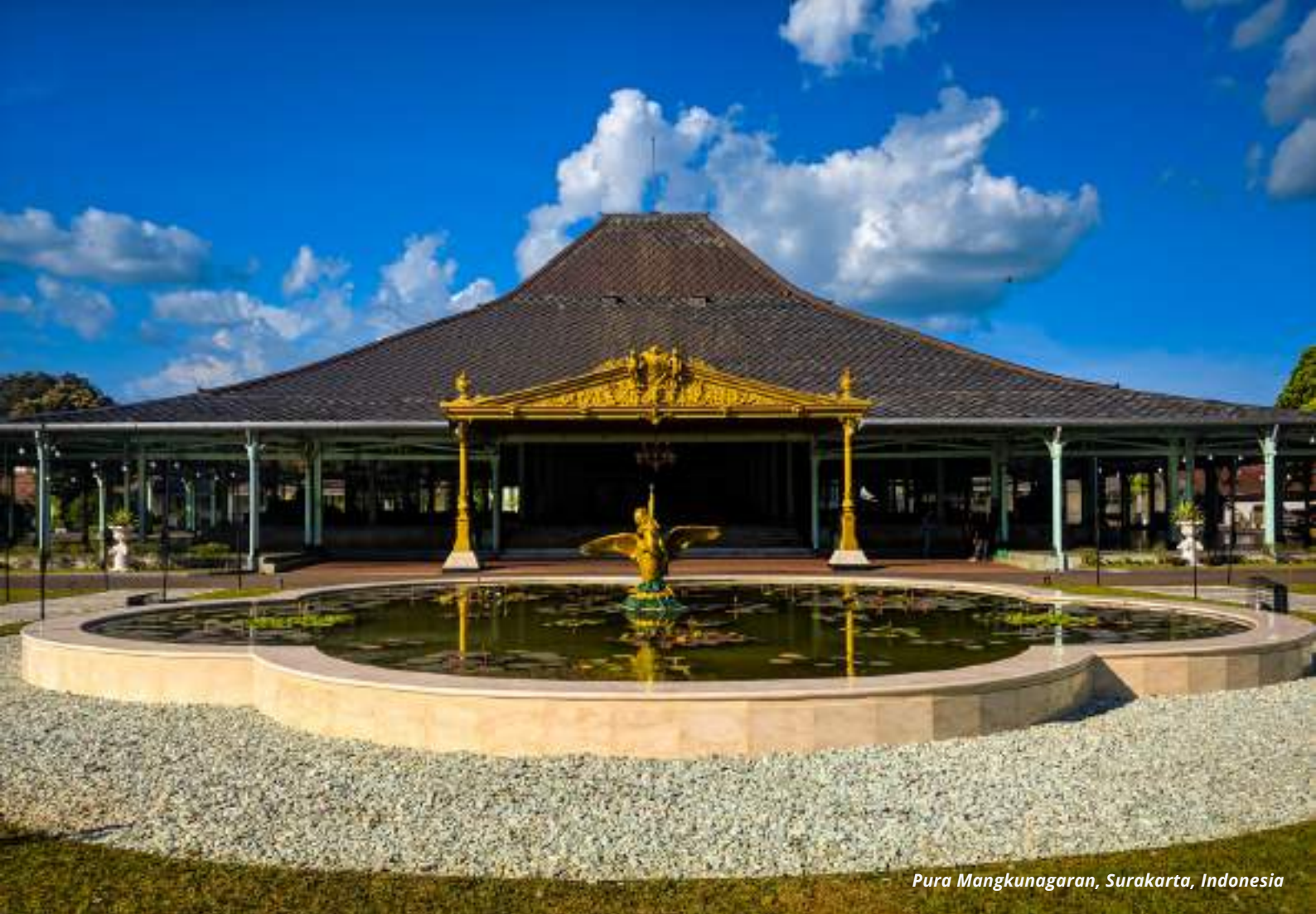
Pura Mangkunagaran, Surakarta, Indonesia