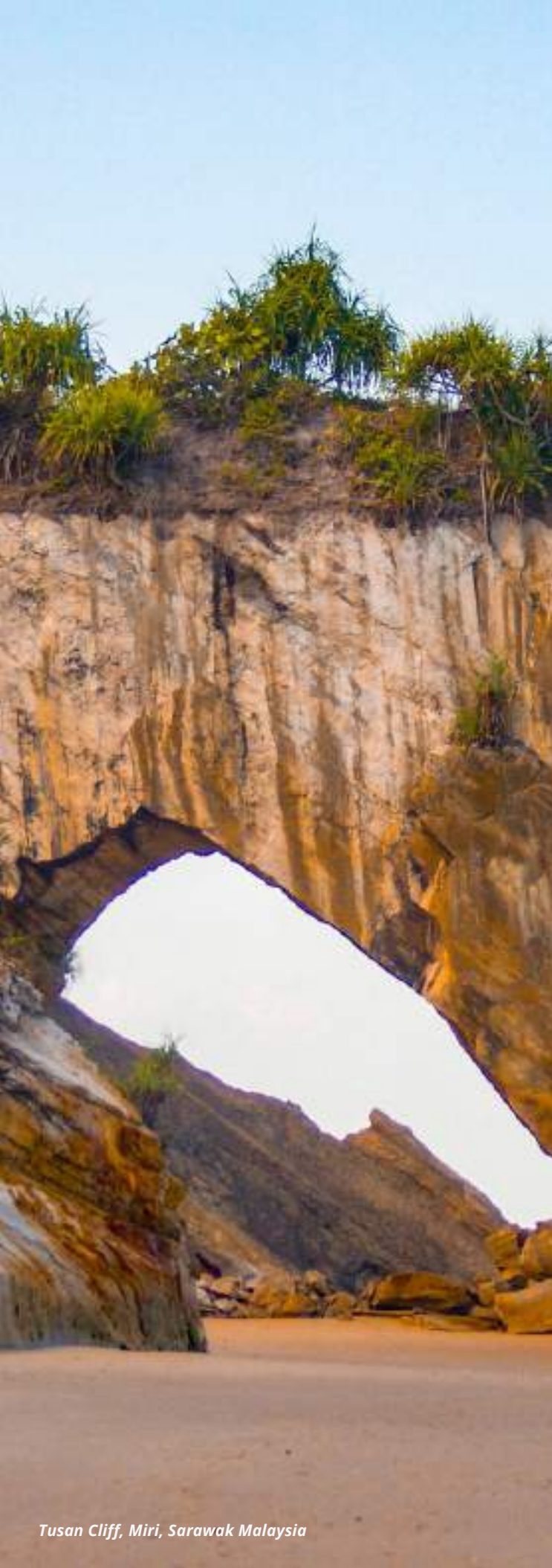
Tusan Cliff, Miri, Sarawak Malaysia