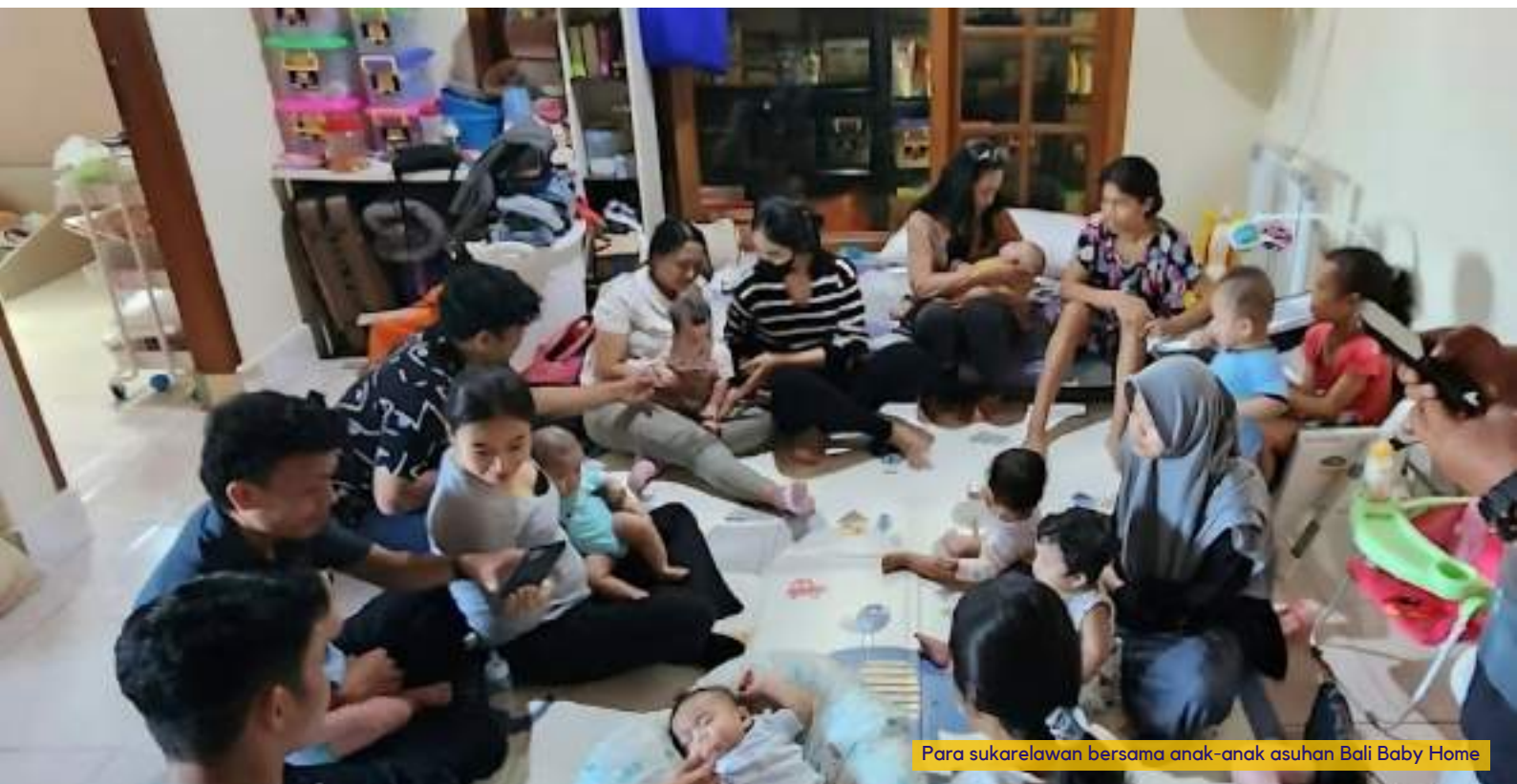
Para sukarelawan bersama anak-anak asuhan Bali Baby Home

Dalam beberapa bulan mendatang, komunitas berencana untuk memformalkan upayanya dengan menjalin hubungan dengan lebih banyak parti asuhan, badan amal lokal, dan organisasi Indonesia.