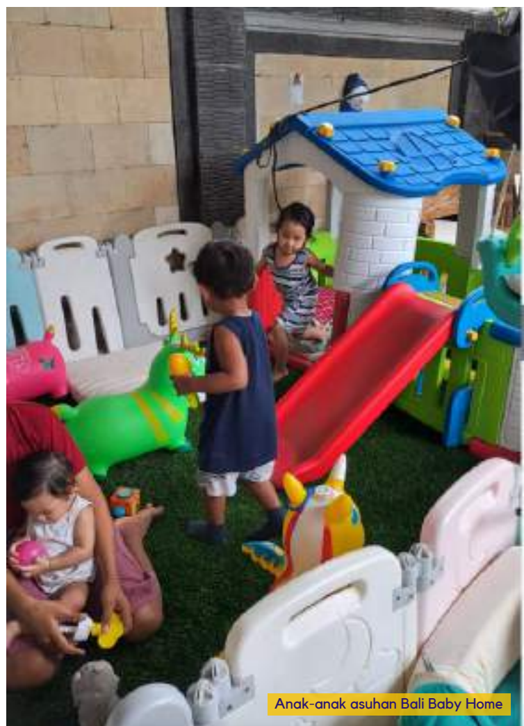
Anak-anak asuhan Bali Baby Home

Melalui tindakan kebaikan tanpa pamrih mereka, para anggota Komunitas Bali Yardımsever Türk membuat perbedaan yang mendalam dalam kehidupan orang lain, sekaligus memperkuat ikatan antara dua budaya, yang disatukan oleh visi bersama tentang kemurahan hati, kasih sayang, dan niat baik.