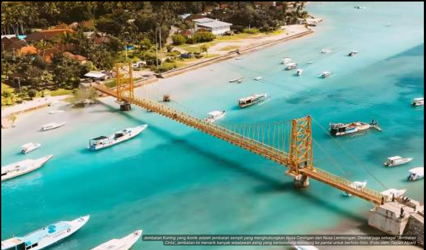
Jembatan Kuning yang ikonik adalah jembatan sempit yang menghubungkan Nusa Ceningan dan Nusa Lembongan. Dikenal juga sebagai 'Jembatan Cinta', jembatan ini menarik banyak wisatawan asing yang berbondong-bondong ke pantai untuk berfoto-foto.