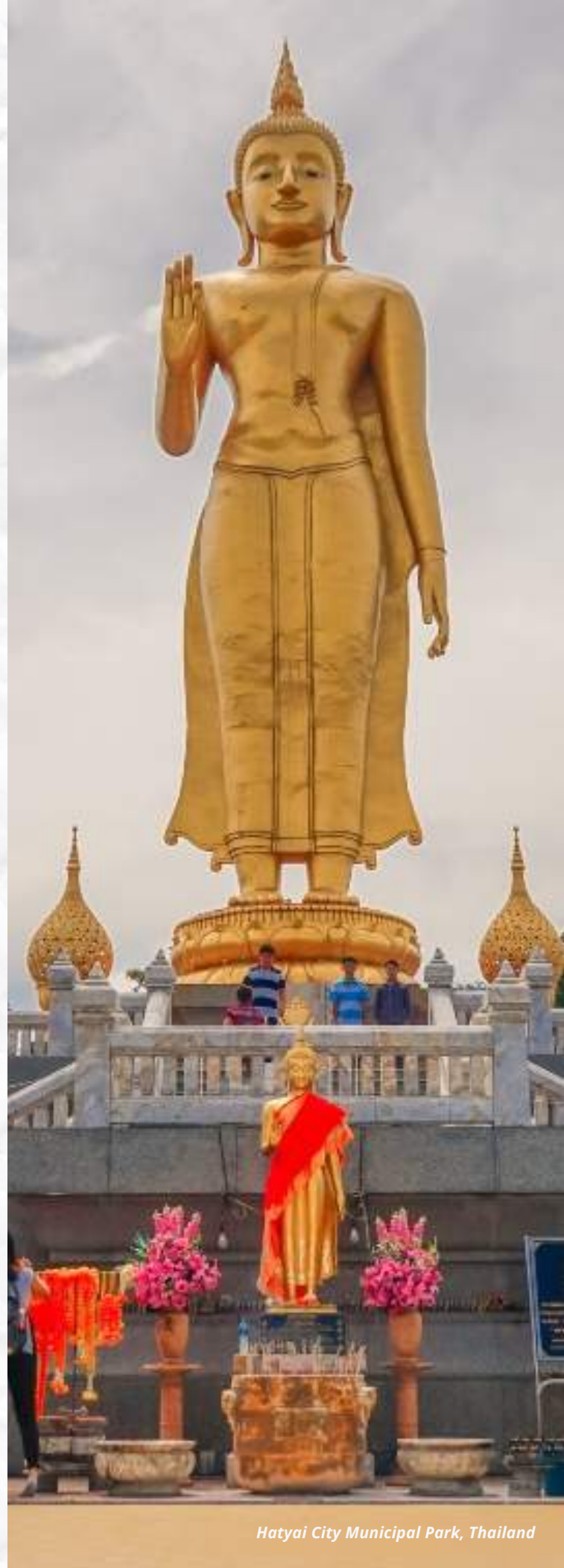
Hatyai City Municipal Park, Thailand

Selama musim liburan, pengunjung dapat menikmati pertunjukan tradisional Jawa yang mempesona, mencicipi hidangan lokal seperti Nasi Liwet, Timlo Solo, dan Dawet. Surakarta adalah destinasi ideal untuk merayakan akhir tahun dengan nuansa budaya yang unik.