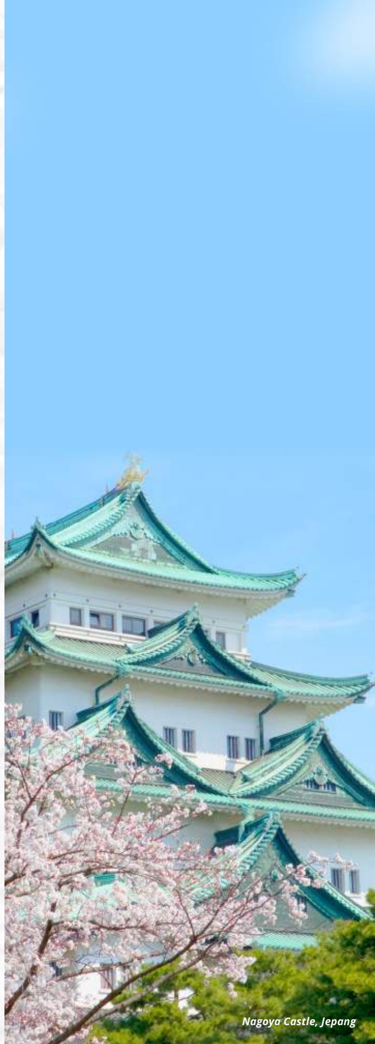
Nagoya Castle, Jepang

Kota ini merupakan destinasi ideal untuk musim liburan, dengan pengalaman memukau seperti taman hiburan La Terrace Winter Village, yang menawarkan suasana Natal yang magis. (HSS)