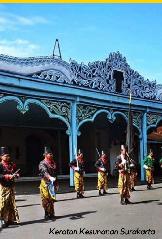
Keraton Kesunanan Surakarta

Sekarang gedung gereja itu telah ditetapkan sebagai sebuah bangunan Cagar Budaya yang dilestarikan, menarik banyak umat termasuk para wisatawan domestik maupun mancanegara beribadah disana.