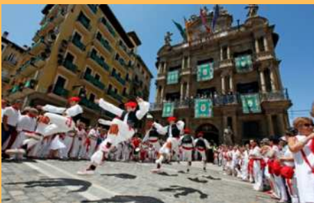
▲ Sebuah festival di kota Pamplona, Utara Spanyol. Untuk festival running of Bulls tahunan dimana ada banteng yang dilepas