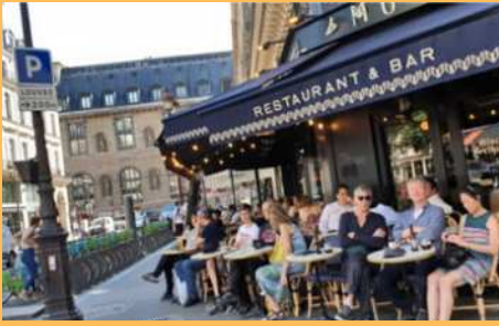
▲ Suasana kota Paris yang dijuluki kota cafe, dimana budaya 'nongkrong' di cafe digemari warganya maupun turis asing.