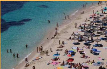
▲ Pantai di Rio de Janeiro penuh warga yang berenang dan berjemur tanpa masker