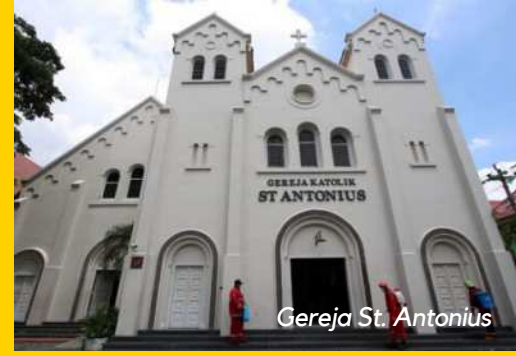
Gereja St. Antonius