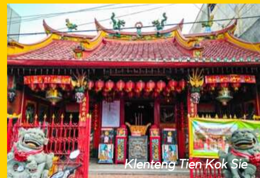
Klenteng Tien Kok Sie

Sekarang disebut pula sebagai Vihara Avolokitesvara. Klenteng itu dibangun pada tahun 1748 berarti tiga tahun setelah Keraton Kasunanan Surakarta Hadiningrat berdiri pada tahun 1745.