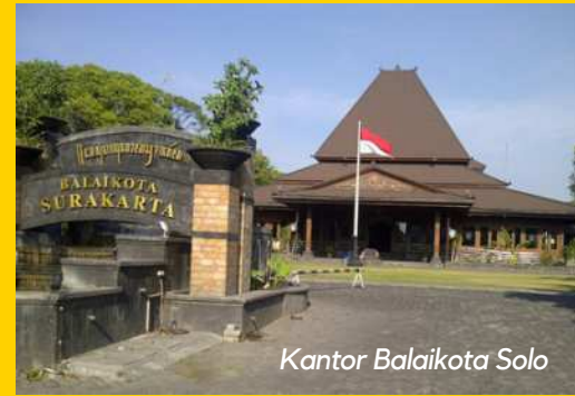
Kantor Balaikota Solo

Terletak di sisi selatan Pasar Gede ada sebuah bangunan Klenteng Tien Kok Sie, rumah ibadah yang dibangun pada 1748 berkonstruksi kayu sangat kokoh. Klenteng itu untuk para umat menyembah "Tian" yaitu Tuhan YME serta Dewi Kwan Im yang dikenal sebagai Dewi Welas Asih.